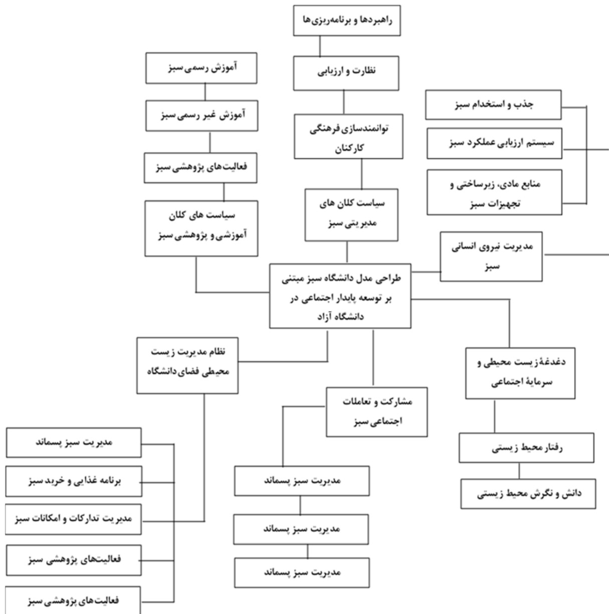
شکل ۳. شبکه نهایی مضامین مدل دانشگاه سبز مبتنی بر توسعه پایدار اجتماعی