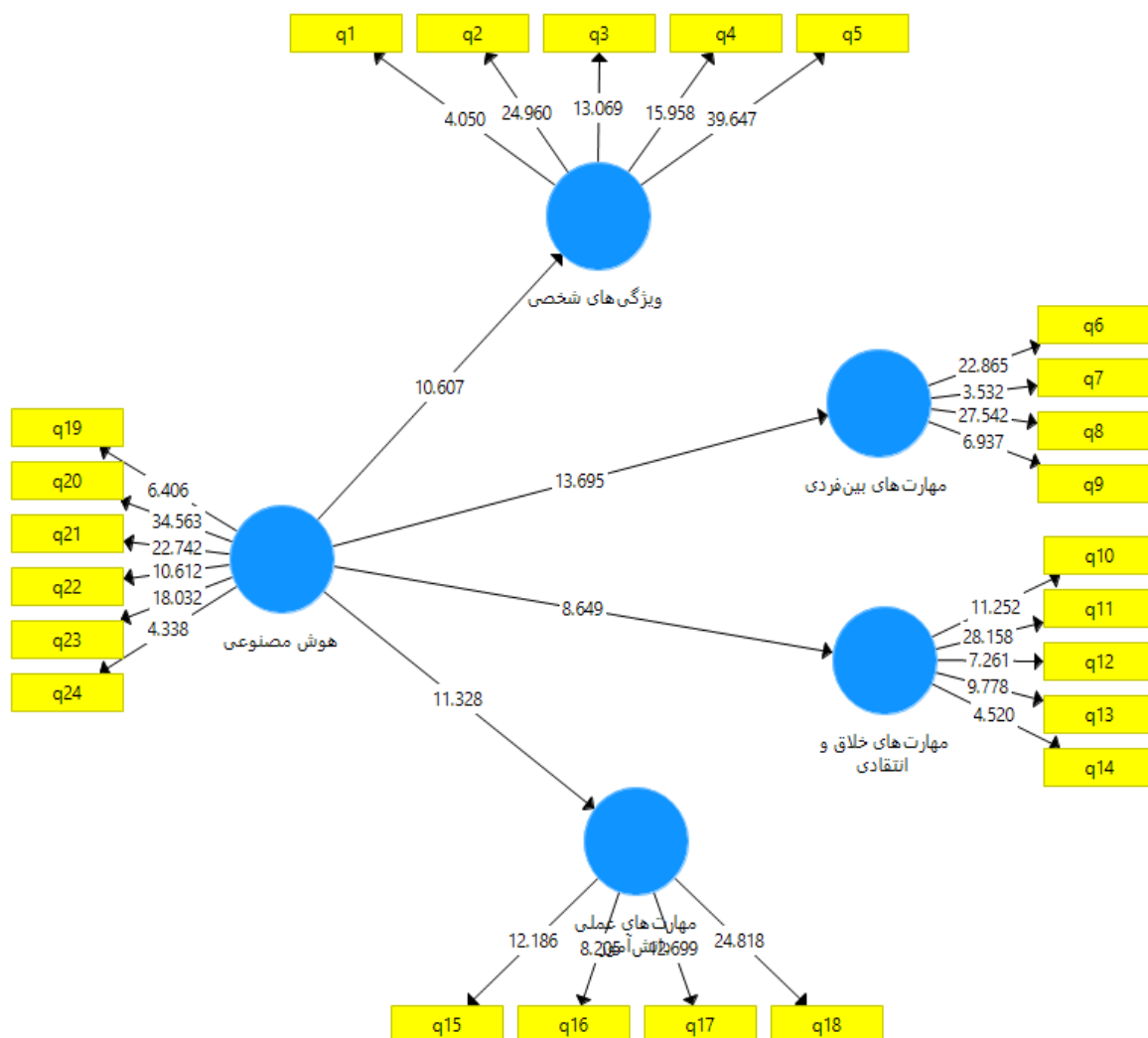
شکل ۲. تحلیل عاملی تاییدی (آماره t-value)