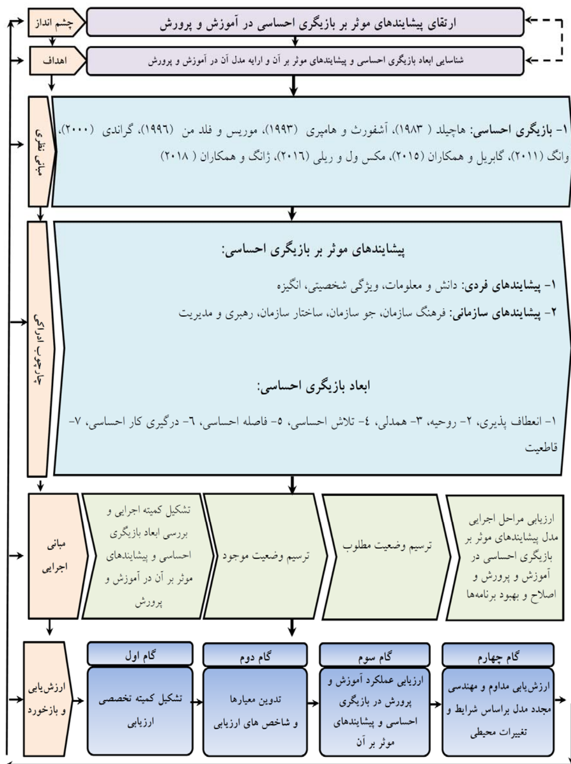
نمودار ۳: مدل پارادایمی پیشایندهای مؤثر بر بازیگری احساسی در آموزش و پرورش استان گلستان